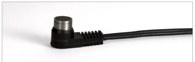
新开发的D7910探头性能强大，价格便宜。

27MG的标准配置带有经济实用的D7910双晶探头，用户使用这款探头可以完成很多基本腐蚀应用的测厚操作。Olympus还有种类齐全的双晶探头系列产品，可以对极薄、极厚的材料，或小直径管件进行测量。与27MG兼容的Olympus探头带有自动探头识别功能，可通过自动调用默认V声程校正的方式，优化探头的性能。