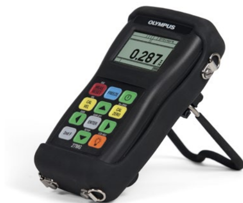
装有可选橡胶保护套的27MG，保护套上带有颈挂带和仪器支架

北京时代山峰科技有限公司 北京市海淀区清河小营西路27号金领时代大厦1202室 电话：010-82729152 82729153 传真：010-82915752 邮编：100085 www.59117.com.cn